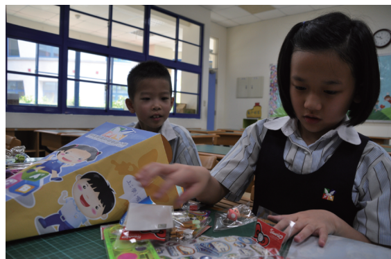
↑ 入學當天孩子開心的打開入學禮物袋